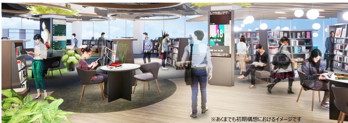
※あくまでも初期構想におけるイメージです

これまでの図書館利用者の方々に加えて今まで図書館に関心がなかった人にも楽しんでいただける施設にすることにより、多様な人が集い、地域に更なるにぎわいをもたらせる図書館を目指します。