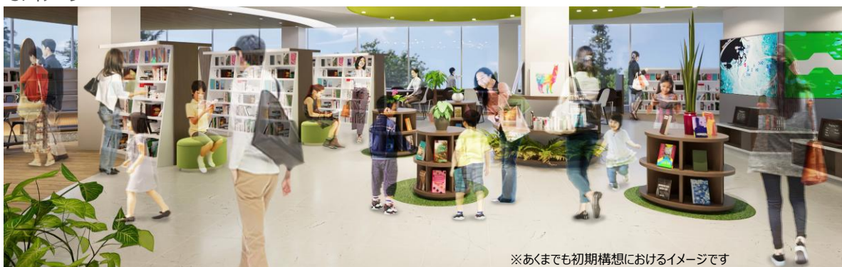
※あくまでも初期構想におけるイメージです

4階は「落ち着いて過ごせるフロア」とし、ゆっくり読書を楽しんだり、集中して学習や調査研究に取り組むことが出来るフロアになる予定です。