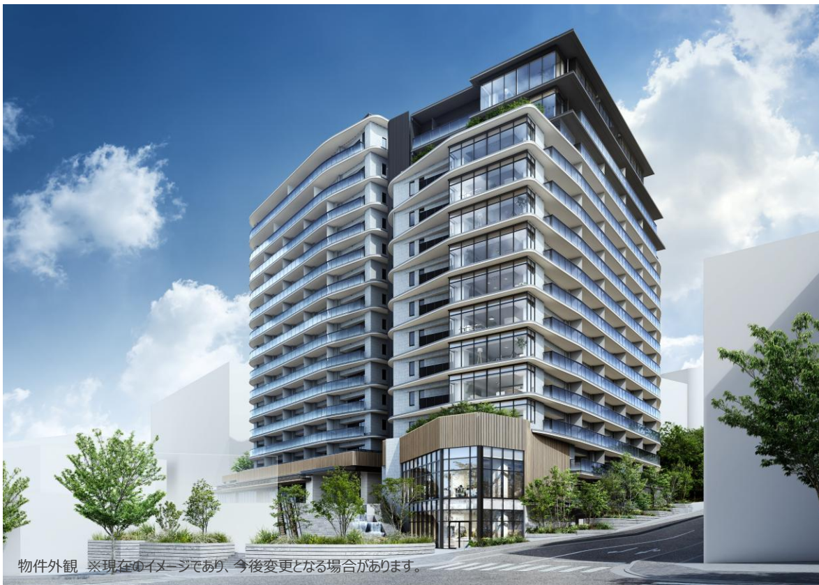
物件外観 ※現在のイメージであり、今後変更となる場合があります。

低層部には、「星が丘テラス」の増床部分となる商業区画を整備し、再開発エリアとしての一体的な利用や賑わいに貢献するとともに再開発で完成される洗練された都市機能と自然環境を共存させた新たなライフスタイルを提供してまいります。